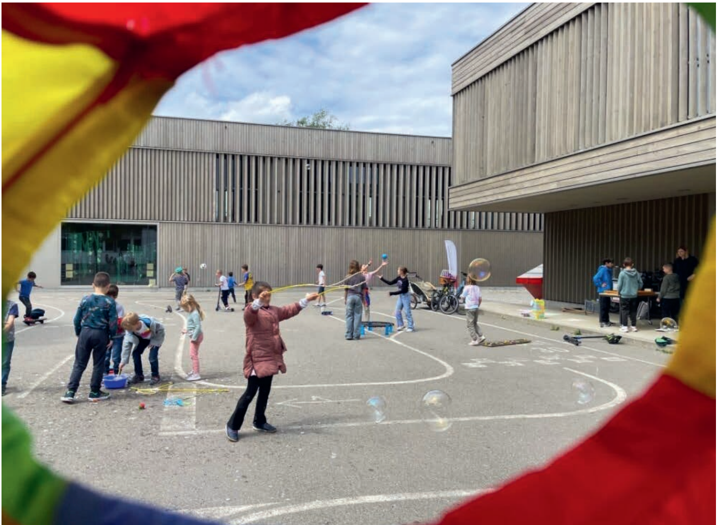
© Stadt Sursee Fachbereich Gesellschaft, Aktion zum Weltspieltag 2024